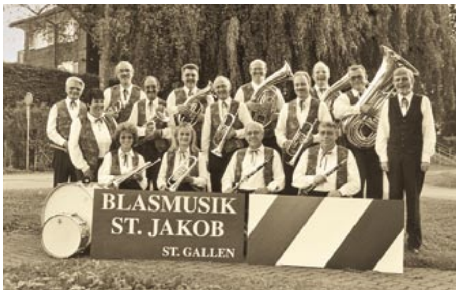
Bereits unter dem früheren Namen «Blasmusik St. Jakob St. Gallen» interpretierten die heutigen Gallus Musikanten mit Vorliebe volkstümliche Blasmusik.

Im Laufe der Zeit suchte die Arbeitermusik aufgrund verschiedener Gesinnungen innerhalb des Vereins eine gewisse Distanz zu der klischeehaften Parteienbindung. So kam es 1974 zur Umbenennung in «Blasmusik St. Jakob St. Gallen» (Jakobsmusik). Diese Bezeichnung unterstrich ganz klar die Herkunft innerhalb der Stadt St. Gallen sowie die damaligen Beziehungen zur dort ansässigen Brauerei Schützengarten. Die vereinsinternen Probleme waren damit aber