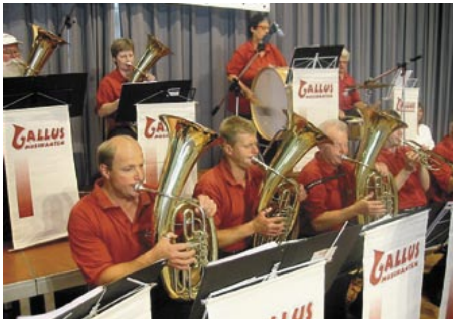
Jährlich geben die Gallus Musikanten zwischen 12 und 15 Konzerte.